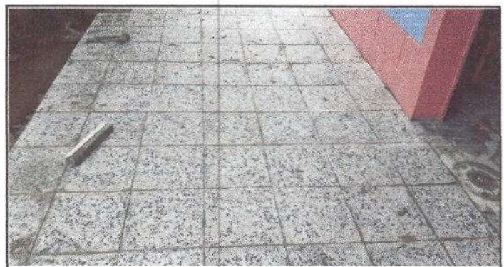
FOTO 12: Instalación de 20 m2 de Piso de Granito, en el corredor de la Cocina.

Observación: Si es necesario se pueden agregar hojas adicionales y actualizar el número de hojas.