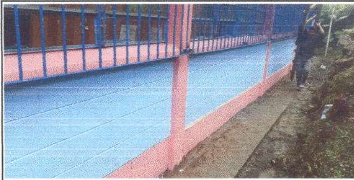
FOTO 3: Aplicación de 504 m2 de Pintura en muros Interiores y Exteriores.