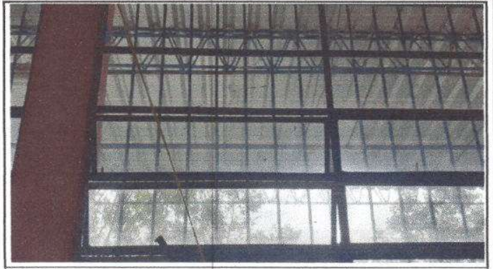
FOTO 8: Instalación de 13 vidrios en estructuras de metal de ventanales.