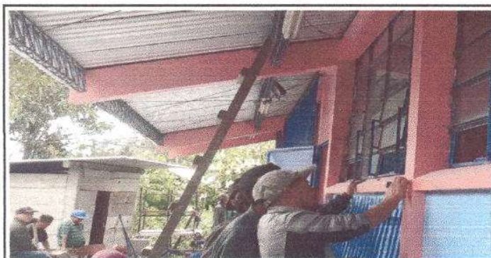
FOTO 5: Instalacion de 9.5 m2 de nuevos Balcones en el Centro Educativo.