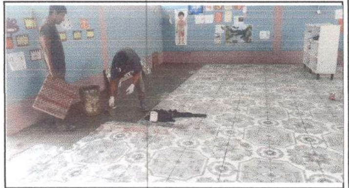
FOTO 2: Sustitución de 177 m2 de piso cerámico en las aulas, bodega, cocina, dirección y las aulas del centro Educativo.