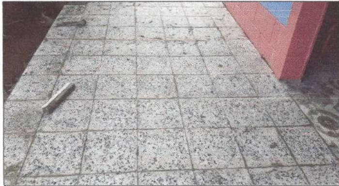
FOTO 1: Instalación de 40 m2 de piso granito en los corredores del centro Educativo educativo.