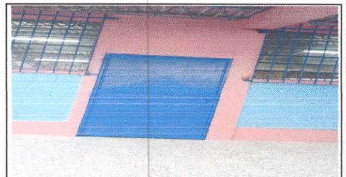
FOTO 6: Mantenimiento a 4 puertas del centro Educativo y 4 puertas de los Servicios Sanitarios

Observación: Si es necesario se pueden agregar hojas adicionales y actualizar el número de hojas.