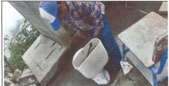
FOTO 10: Instalación de tres inodoros en los Servicios Sanitarios.