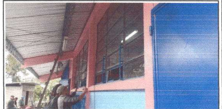
FOTO 4: Mantenimiento a las estructuras de metal de los Balcones del Centro Educativo 46 m2.